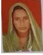
2. मीना कुमारी